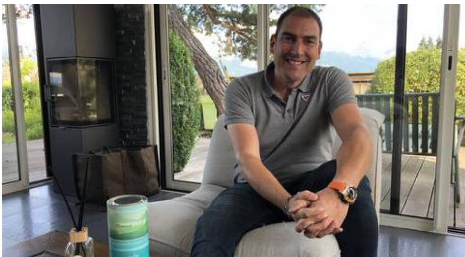
Les parfums Ode Anancy sont officiellement lancés pour cet été.

Résultat, Edouard Maumejan et l'Atelier français des ma-